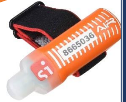
Système SIAC actif

Briefing 15 min avant le départ puis convoi pour aller au départ tous ensemble